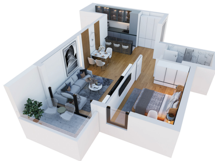
3D prikaz stana