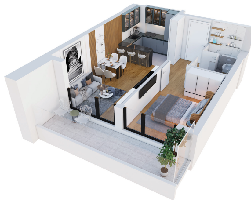
3D prikaz stana