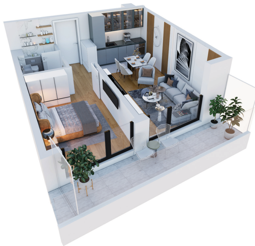
3D prikaz stana