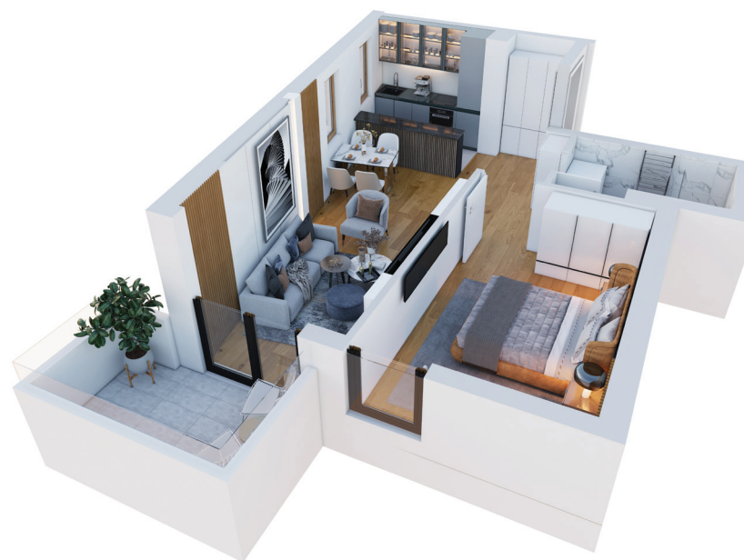
3D prikaz stana