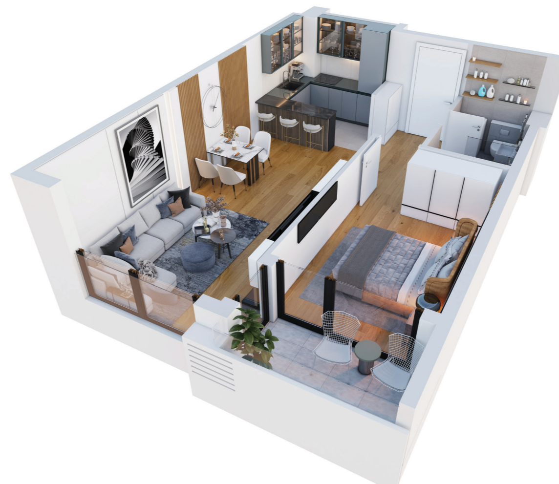
3D prikaz stana

Prikazi enterijera su informativnog karaktera i nisu predmet prodaje. Za više informacija obratite se prodajnom timu „Zelene avenije“.