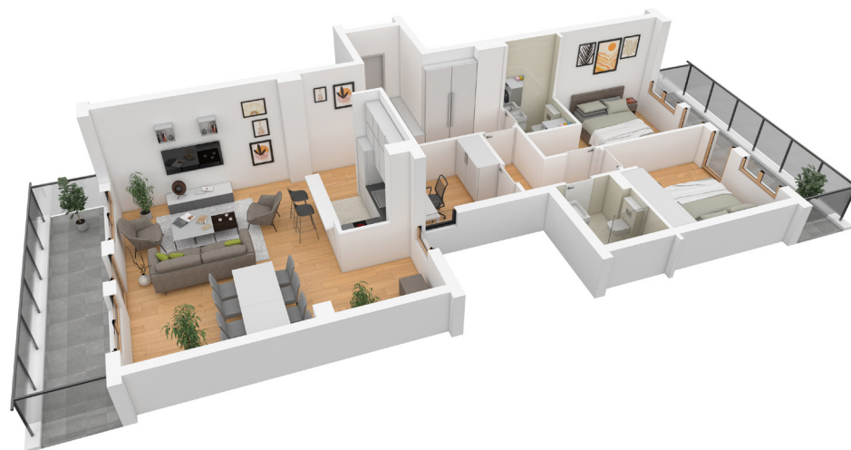
3D prikaz stana

Prikazi enterijera su informativnog karaktera i nisu predmet prodaje. Za više informacija obratite se prodajnom timu „Zelene avenije“.